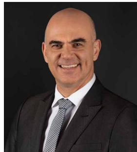
B Alain Berset