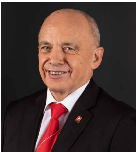
A Ueli Maurer

42. Welche Bundesrätin oder welcher Bundesrat ist für die Bildung (Eidgenössisches Departement für Wirtschaft, Bildung und Forschung WBF) zuständig?