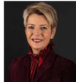
D Karin Keller-Sutter

43. Welche Aussage zur Bildung im Kanton Bern ist richtig?