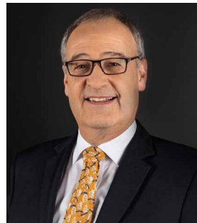
C Guy Parmelin